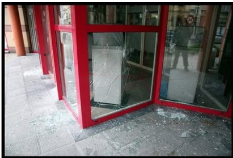
Glasbruch in Gent

25/11 Dendermonde - Gefangene besetzen den Innenplatz des Gefängnisses.