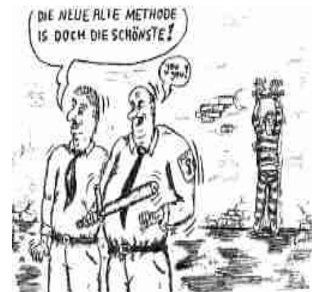
Finni - Methodenlehre

Am 04. Juli 1937 trafen sich im Berliner Reichsjustizministerium hohe Richter...Staatsanwälte... und Gestapo-Beamte. Sie verhandelten über die sogenannte „verschärfte Vernehmung“.