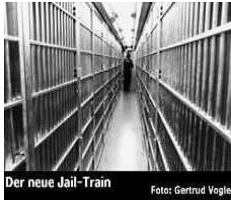
Gefangenentransporterzug in der Schweiz

Die Fahrt in einem Transportwagen (in dem man zu viert, zu zweit oder alleine sitzen muss), der für 2 dann nicht mal 1 Quadratmeter groß ist, dauert je nachdem immer 2-3 Stunden am Stück. Wie Vieh eingepfercht und wie zu Zeiten der Gestapo, im Namen einer Gesellschaft ohne Tadel...! Menschen, die wie Tiere behandelt werden. Menschliche Wesen, die von dem Rütteln des Fahrzeugs und dem Gedränge der Mitgefangenen krank gemacht, sich gegenseitig bekotzen müssen – wenn es mal vorkommen sollte, da sie aus Platzmangel nirgendwo anders hinmachen können.