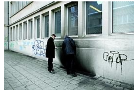
Brandanschlag in Brüssel

23/12 Brugge - Zusammenkommen am geschlossenen Zenter (Ausschaffungsknast) gegen alle Zentren und Ausschaffungen.