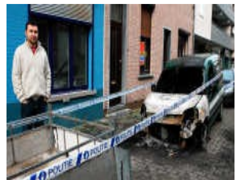
Ausgebrannter Wagen von 'Denys'

27/03 Gent - Ein Auto von 'Denys' wird in Brand gesteckt.