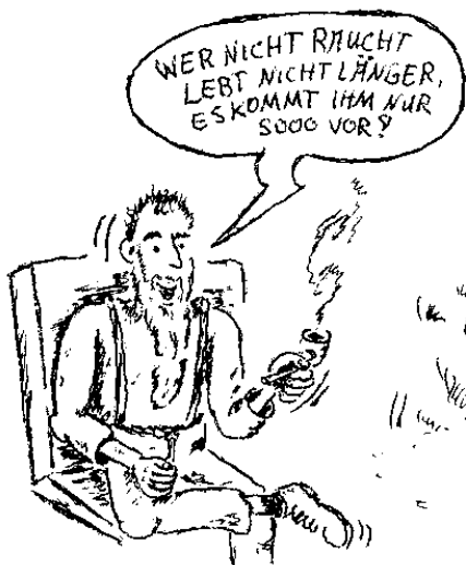
Finni – 'über's Nichtraucher'