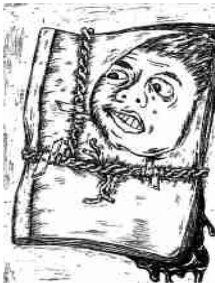
Finni - 'Akte'

einem Schurkenstaat, der wird beim Blick hinter die Kulissen des deutschen Strafvollzugs eines Besseren belehrt. Dieses Kapitel befasst sich mit dem Trugschluss der Unantastbarkeit von Verteidigerpost. Beispielhaft belegt durch einen Fall in der JVA Mannheim im Jahre 2006. Du kannst ähnliches berichten oder gar 'ein Lied davon singen'? Worauf warten, Bericht, Beitrag, Artikel an den Mauerfall! - Michel.]